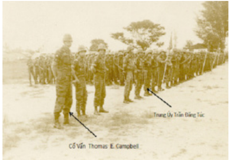
Trâu Điền TQLC ở Trung Tâm Huấn Luyện Vạn Kiếp (1966)

Nuốt đi, mình không giống ai, đừng nhìn ai,