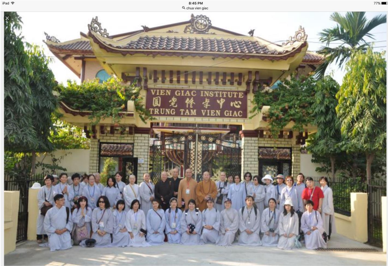
quangduc.com trung-tam-vien-giac-an-do.jpg Images may be subject to copyright.

Oklahoma (OK) là một tiểu bang ở vùng Trung Tây Hoa Kỳ, có biệt danh là “OKLAHOMA, TIỂU BANG CỦA NHỮNG NGƯỜI ĐẾN SỚM” (THE SOONER STATE); nguyên do là vào năm 1889, chính phủ Mỹ bỏ ngỏ một vùng đất hoang vu, khô cằn còn sót lại, để các di dân da trắng, kể cả người da đỏ địa phương tiến vào làm chủ đất đai sau khi một phát súng lệnh được bắn ra, làm hiệu lệnh. OK được thế giới biết đến với các đặc điểm nhờ có nhiều người da đỏ cư ngụ từ buổi ban đầu lập quốc. Dầu khí là kinh tế chủ yếu, dân cư thưa thớt, tính tình khoáng đạt và đặc biệt nổi tiếng về môn thể thao bóng bầu dục của trường Đại Học Oklahoma.